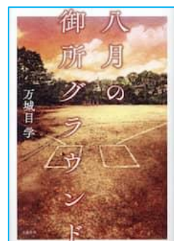
「八月の御所グラウンド」 万城目 学 著