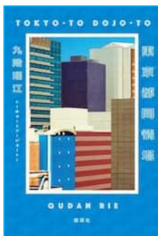
「東京都同情塔」 九段 理江 著